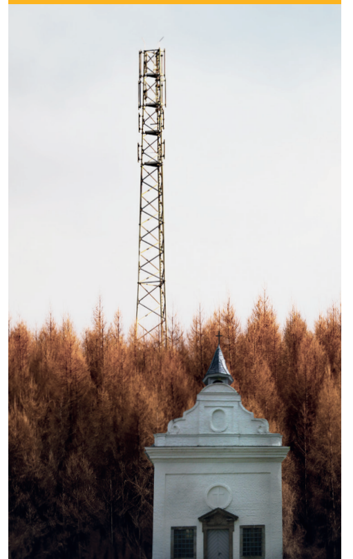
Funkmast (hinten) leerstehende Kapelle des Kinderheims (vorne)

Hier sehen Sie gleich hinter der leerstehenden Kapelle des St. Dohmen Kinderheims den letzten 3G Sendemast Kitzheims. Der 2008 gebaute Funkturm soll nun im Zuge der Abschaltung des 3G Netzes innerhalb der nächsten 2 Monate abgeschaltet und abgerissen werden. Grund seien vor allem häufige Probleme mit Empfangs- und Signalschwankungen.